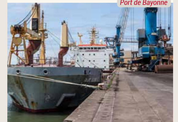
Port de Bayonne