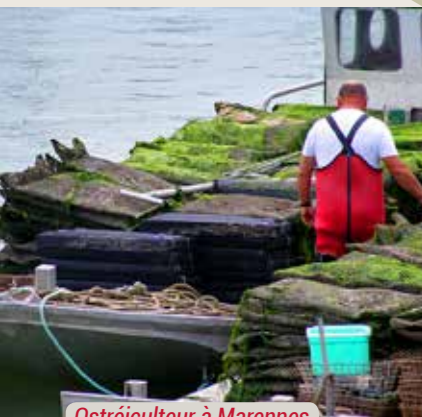
Ostréiculteur à Marennes