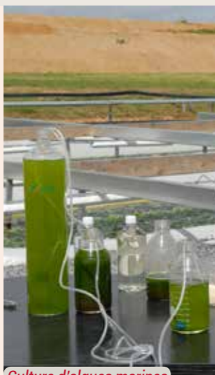
Culture d'algues marines